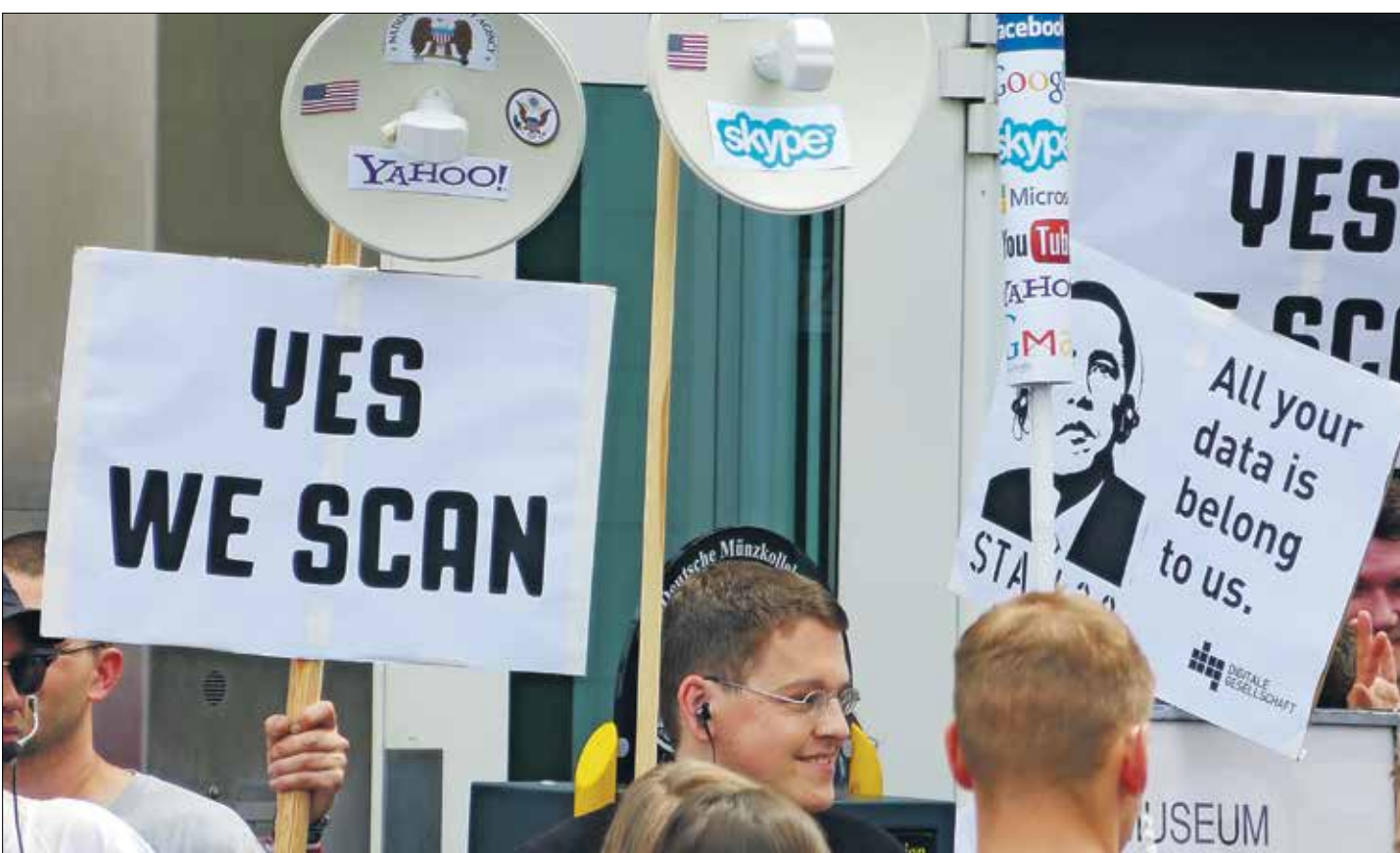
Betogers parodiëren de slogan Yes, we can waarmee VS-president Barack Obama de verkiezingen won in 2008.